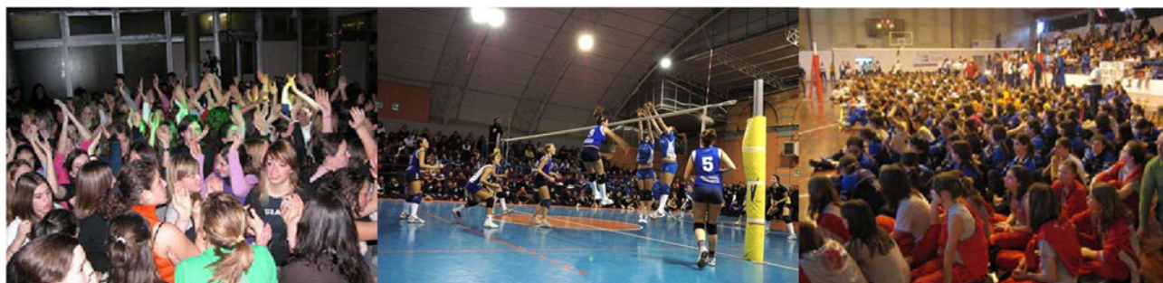
IMMAGINI DI ARCHIVIO: VOLLEYDANCE (1), FINALI (2), PREMIAZIONI (3).

L'esercizio delle OPZIONI 1 e 2, per mere regioni organizzative è vincolante per tutta la comitiva ovvero sia per atleti, dirigenti, allenatori e genitori.